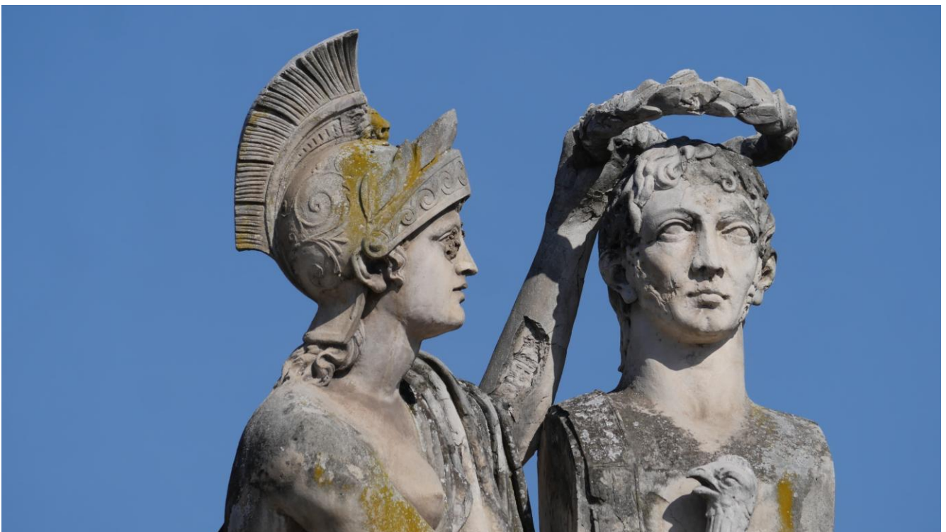
Monument au général Louis Desaix à Riom, détail, mars 2026

Aujourd'hui, ce monument est totalement laissé à l'abandon. La patine du bronze est devenue blanche et le groupe sculpté, détérioré par les intempéries et le manque d'entretien, se retrouve couvert de nids de guêpes. À observer de près, l'on peut même constater l'état catastrophique de l'œuvre.