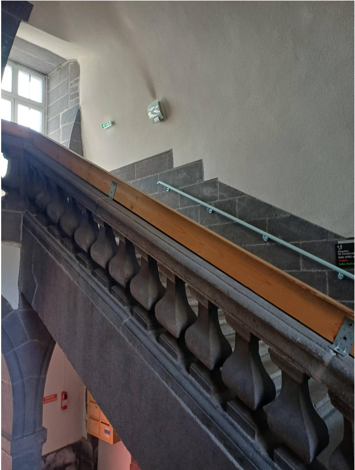
La main-courante qui dénature l'escalier central de l'Ancien Collège des Jésuites