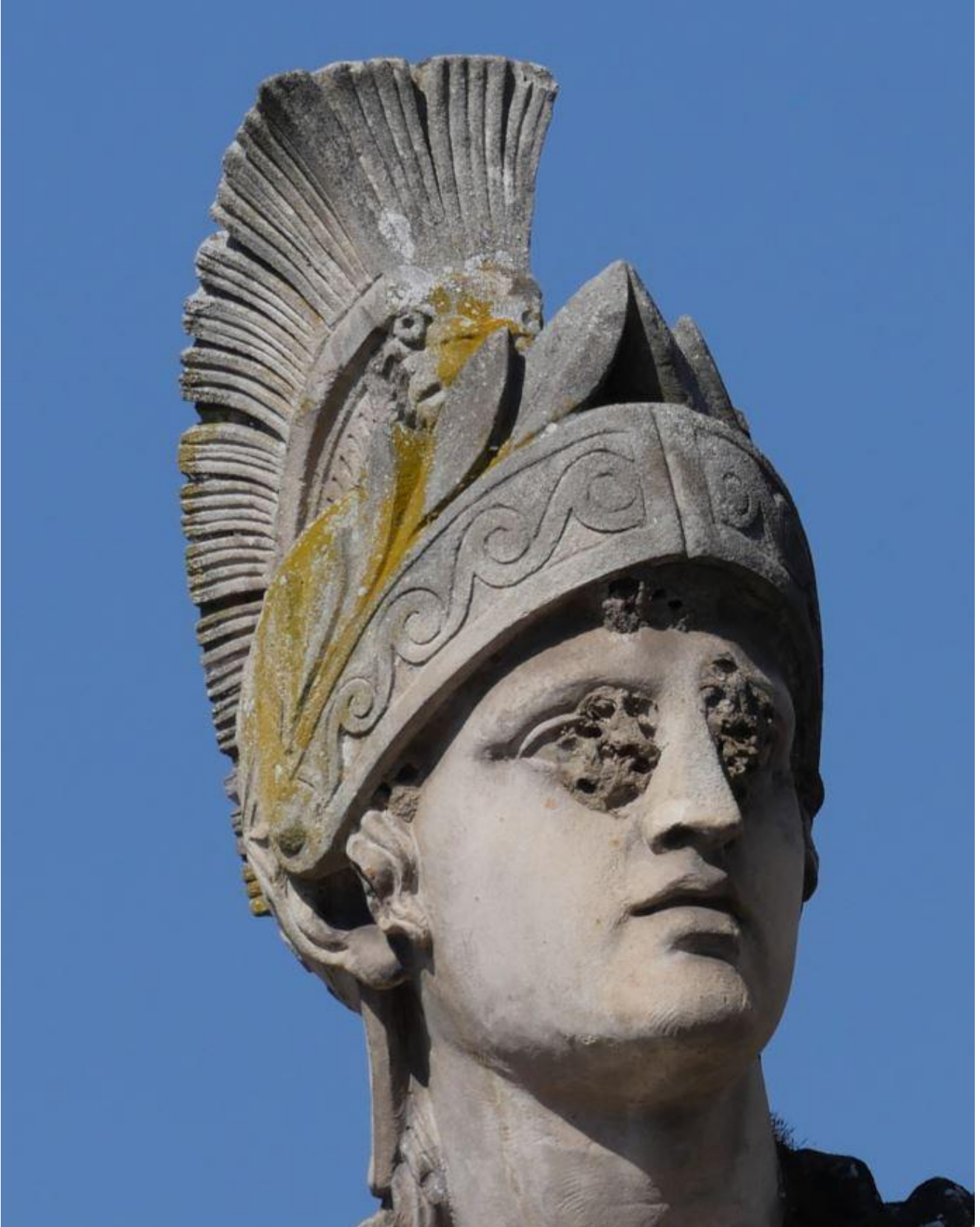
Monument au général Louis Desaix à Riom, détail, mars 2026