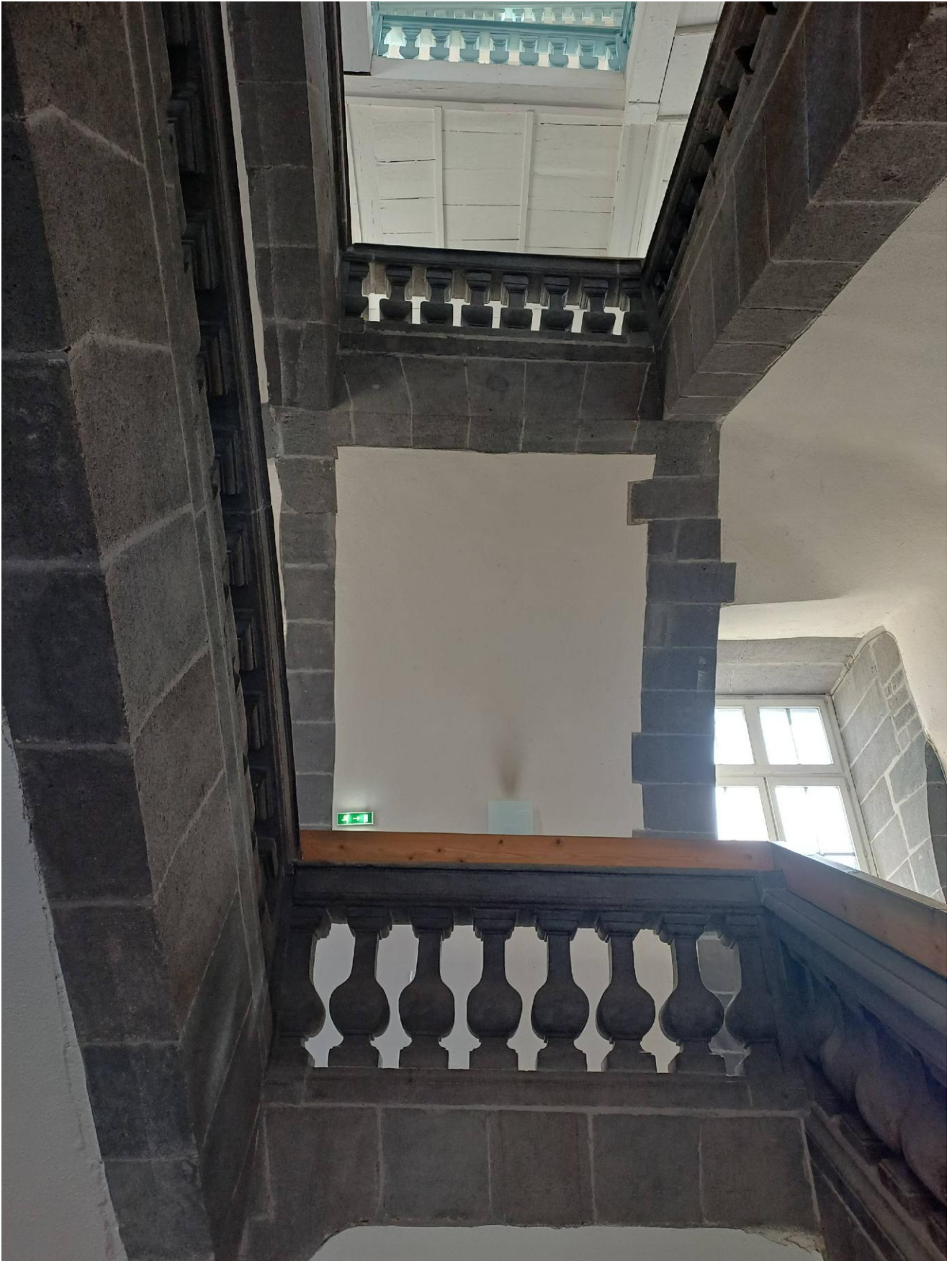
La main-courante qui dénature l'escalier central de l'Ancien Collège des Jésuites