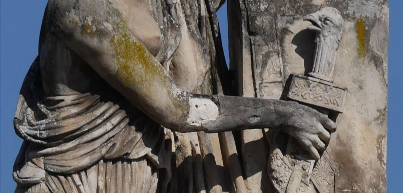
Monument au général Louis Desaix à Riom, détail, mars 2026