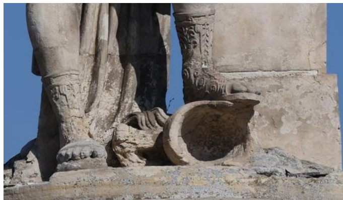
Monument au général Louis Desaix à Riom, détail, mars 2026

Ci-dessus, on remarquera que la déesse pose un pied sur le casque à la romaine du général. Mais aujourd'hui, voyez ci-dessous le casque qui a perdu son protège-joue.