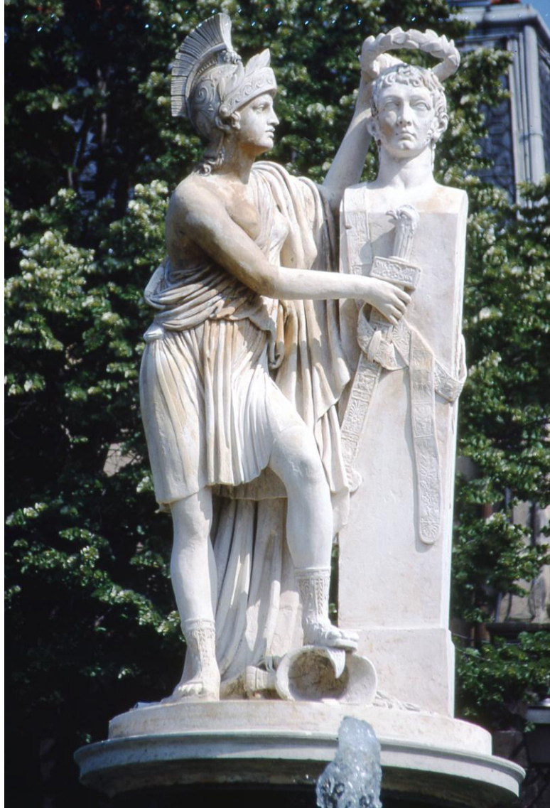
Monument au général Louis Desaix à Riom, vers 1985-1990

Ci-dessus, on remarquera que la déesse pose un pied sur le casque à la romaine du général. Mais aujourd'hui, voyez ci-dessous le casque qui a perdu son protège-joue.