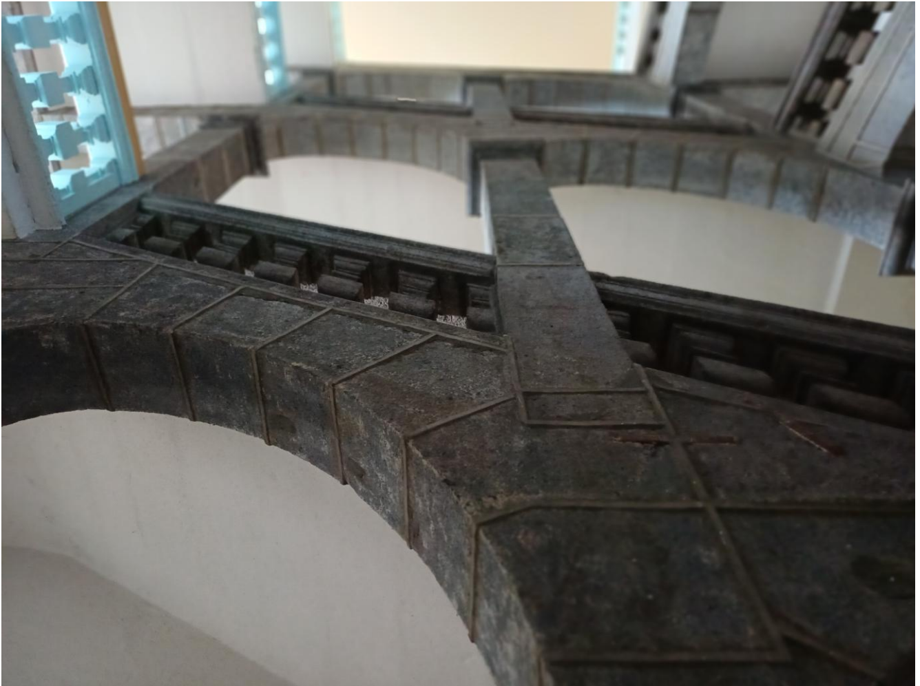
L'imposant escalier central de l'Ancien Collège des Jésuites

Comment a-t-on pu laisser faire une telle atteinte à l'esthétique de cet escalier ?