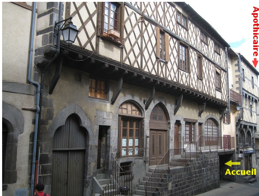
L'entrée du Centre d'Information au 6 rue de la Rodade

Au 6 rue de la Rodade serait l'entrée d'un Centre d'Information sur la mise en valeur et les travaux de rénovation du Vieux-Montferrand. L'accueil se ferait dans l'une des plus belles cours de la ville.