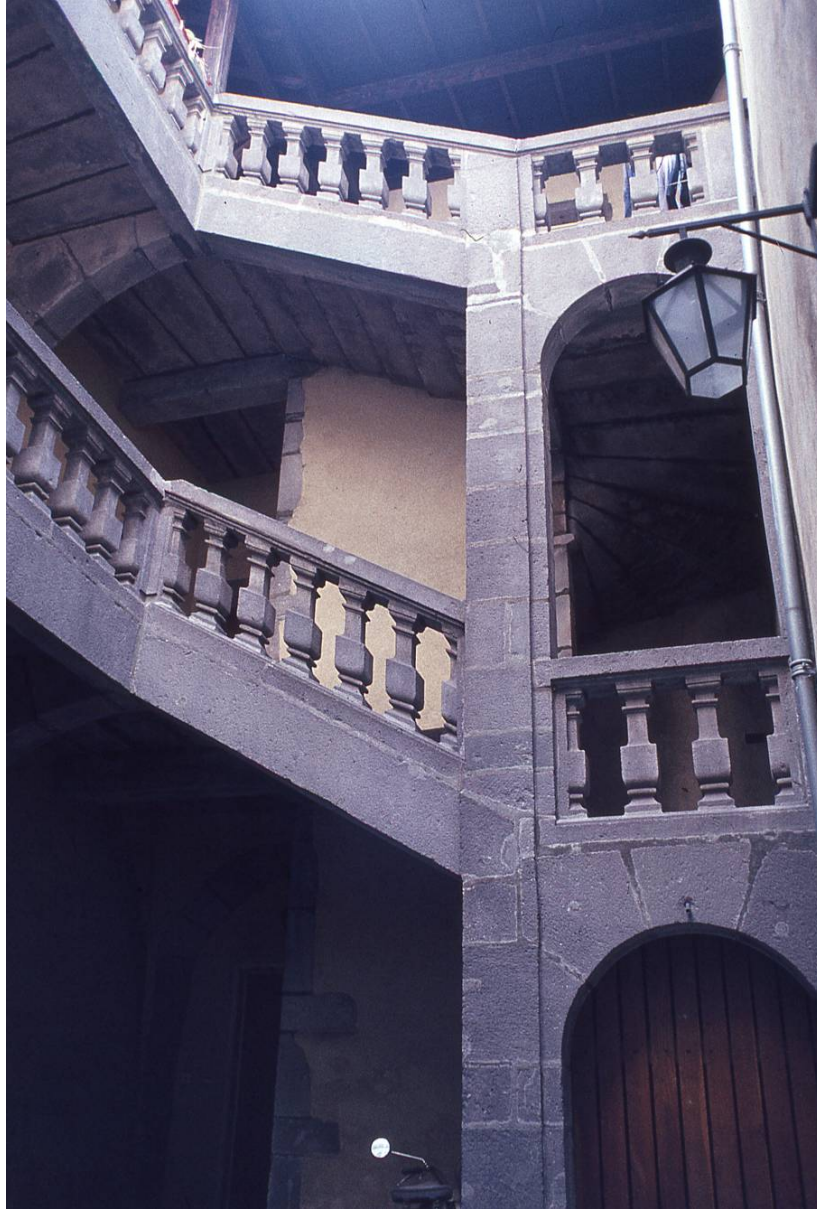
La cour au 6 rue de la Rodade

Par cette cour se fait l'accès aux premier et deuxième étages du 1 rue des Cordeliers où serait installé le Centre d'Information.