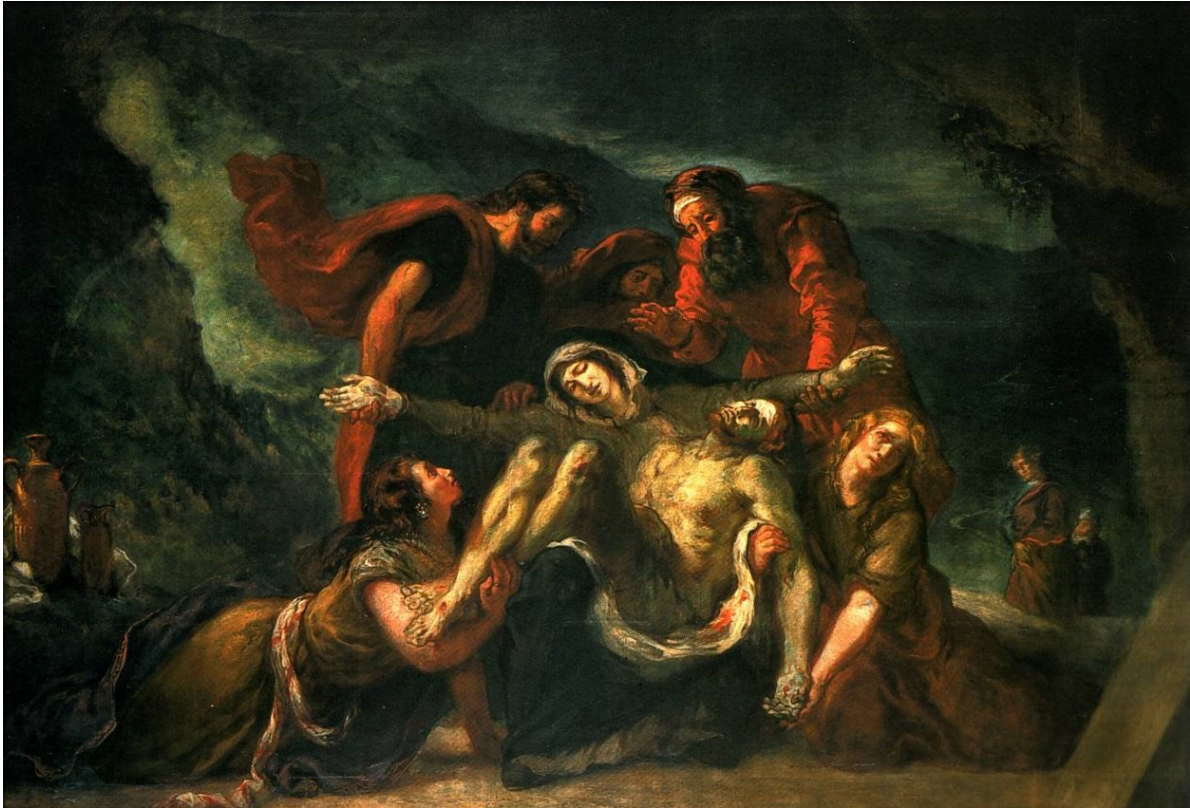
La Vierge de Pitié (1844), Eugène Delacroix Saint-Denis-du-Saint-Sacrement, Paris