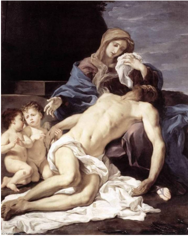
Pietà (1667), le Baciccio

Nous avons vu précédemment que la Pietà crucifiée d'Eugène Delacroix peinte à fresque en 1844 dans l'église Saint-Denys-du-Saint-Sacrement pouvait avoir un air de famille avec la Pietà au bras tendu peinte par le Baciccio 1 en 1667 2 . Mais si l'on part de cette dernière œuvre, nous allons, en guise de post-scriptum, trouver une filiation qui nous mène jusqu'à Vincent Van Gogh 3 .