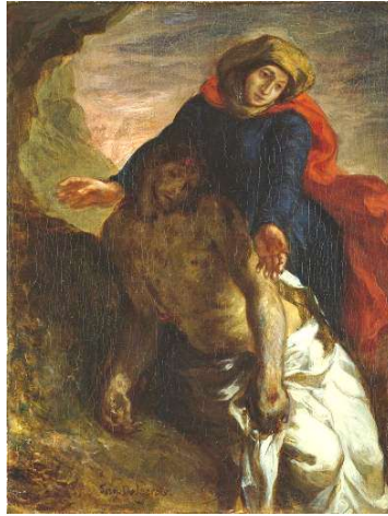
Pietà (1850), Eugène Delacroix