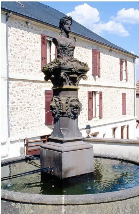
La Fontaine de la place Gudin

À Château-Chinon, dans la Nièvre, il faut absolument connaître la Fontaine Niki de Saint-Phalle 3 , voulue par François Mitterrand 4 . Non loin de cette œuvre inaugurée le 10 mars 1988, se dresse dans un contraste saisissant une fontaine en pierre de Volvic. Située place Gudin, celle-ci est signée Compain 5 , à Volvic.