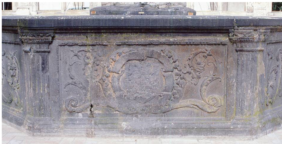
Fontaine de Beaune-Semblançay (1511), Tours