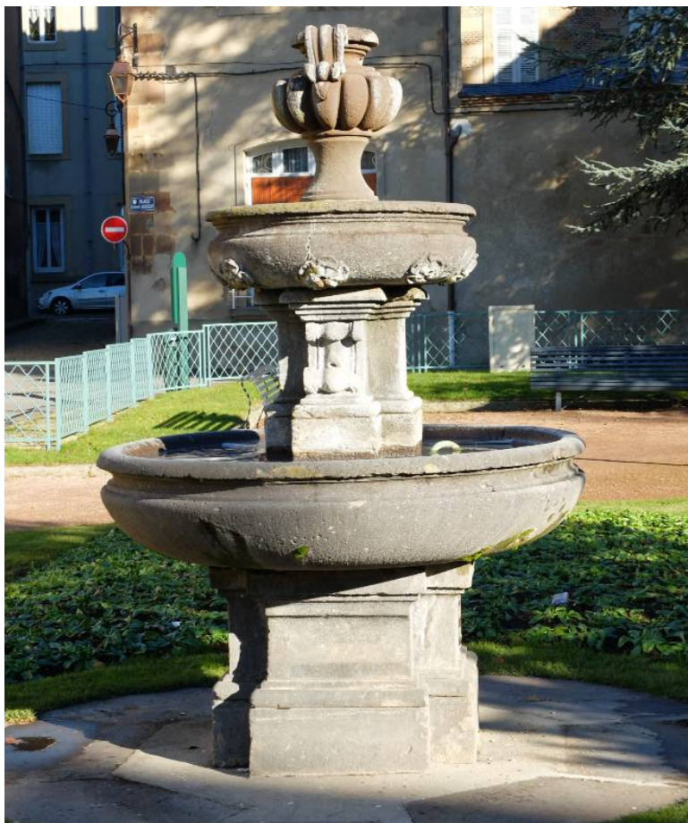
Fontaine Anne-de-Beaujeu (XIX e siècle), Moulins