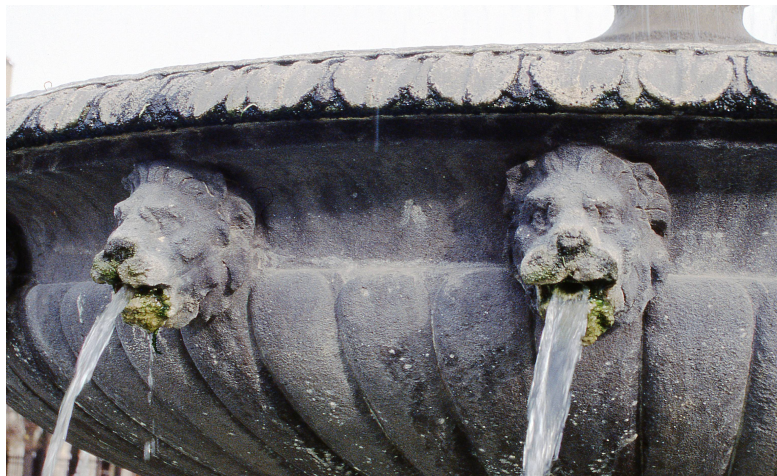
Une fontaine de la place des Vosges (1825), Paris

© Daniel Lamotte (texte), Pascal Piéra (photographies), février 2021.