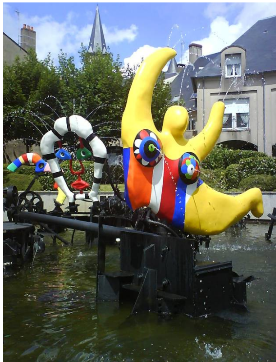
La Fontaine Niki de Saint-Phalle