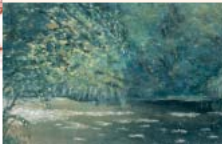
Étang aux nénuphars.

Le peintre auvergnat Émile Méry (1914-2000) suivit un chemin bien personnel : venu de la coiffure, il abandonna brusquement ce premier métier pour les pincesaux et les tubes de couleurs.